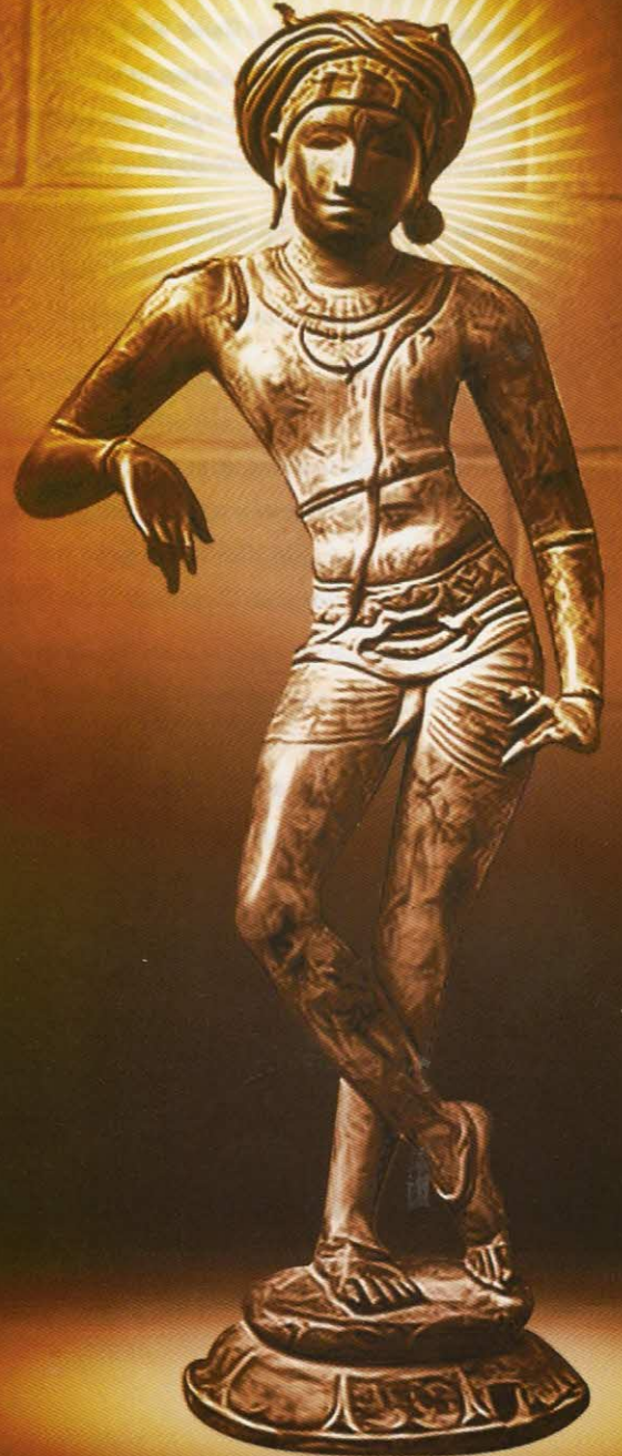
"Marathadiyil Vozhippokan" Shiva Statue from 10 th Century AD

Mayapuri Graphic Workstation Private Limited