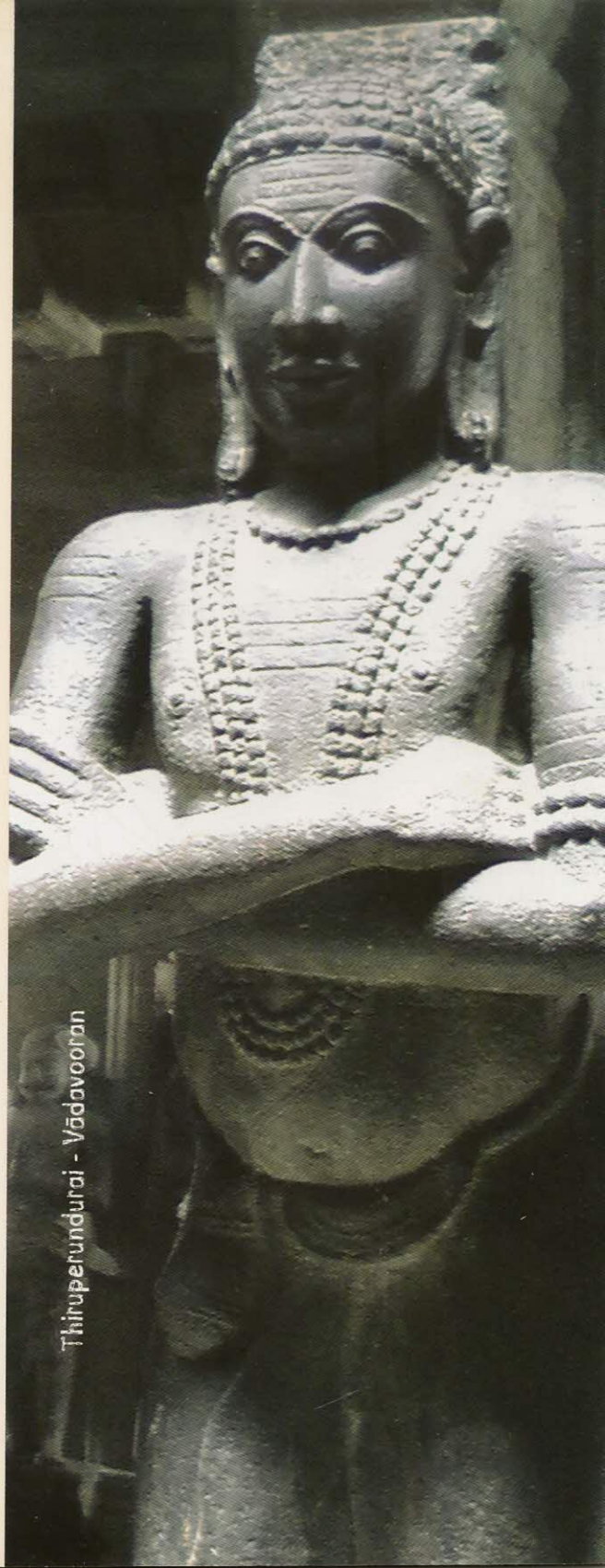
Thirupeturundurai - Vādavooran

What could possibly have motivated a poet to compose such vibrant verses? Could it be his extraordinary skill with words? Could it be his learning and experiences through life? Or could it be... the touch of God?